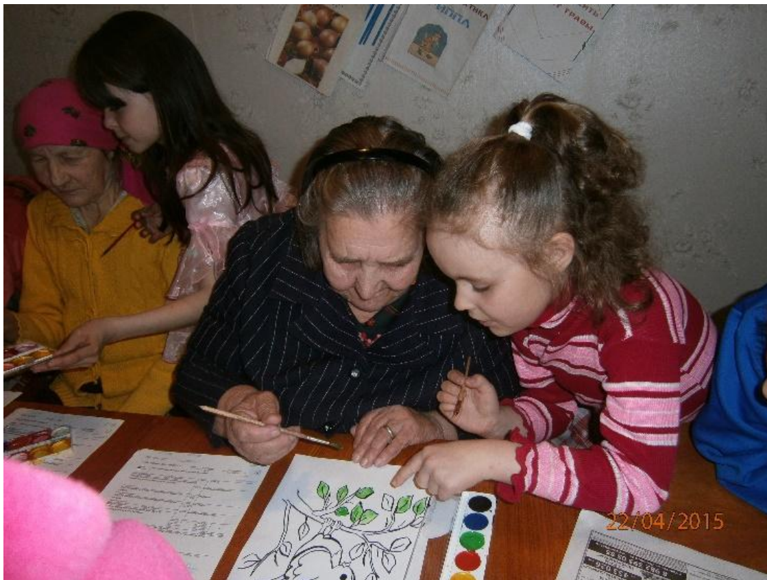
Мастер-класс «Рисуем вместе»