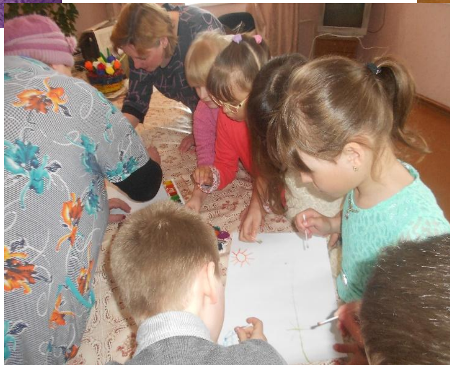
Мастер-класс «Весенние мотивы»