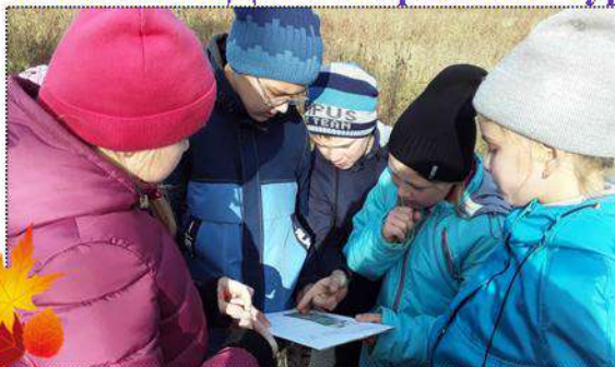
Определи лекарственные травы