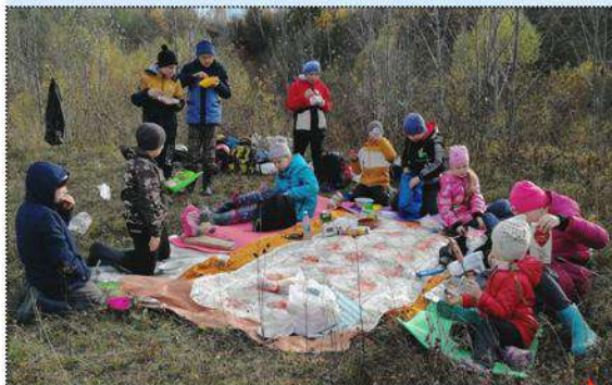
Обед по расписанию!