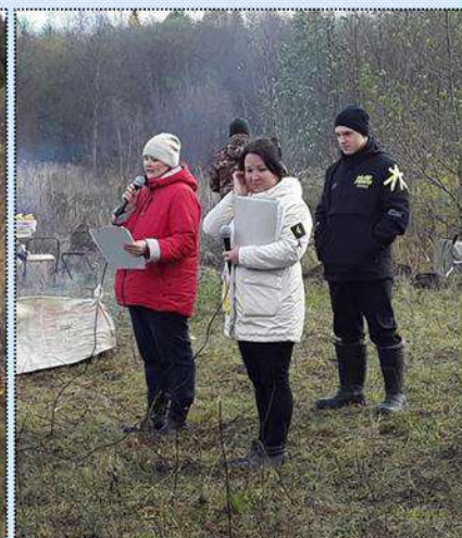
Построение команд. Торжественное открытие туристического слёта.