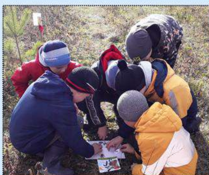
Что возьму с собой в поход