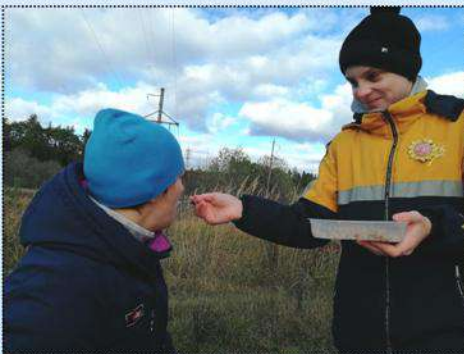
Очень вкусная каша!