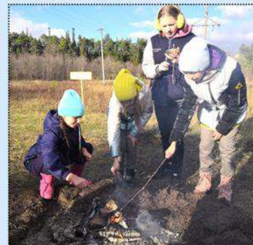
Жареный на костре хлеб — тоже вкусно!