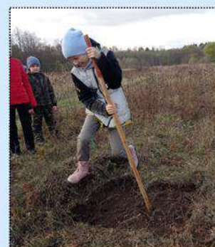
Переправа с шестом