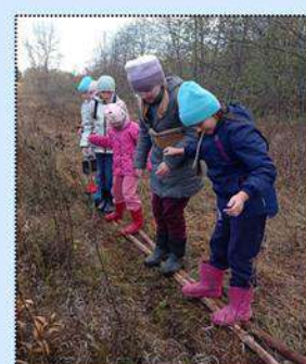
Переправа по гати

Путь далекий — нам известно Рядом с другом не далек. В рюкзаке — про горы песня, Кружка, ложка, котелок.