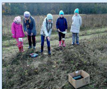
Метко в цель