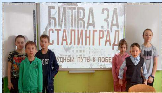
Учащиеся начальной школы