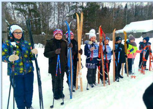
Построение перед стартом

Дружным стартом вышли на «Лыжню России» елизаровские учащиеся.